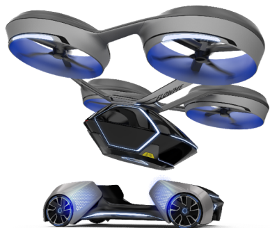
Projeto Flow.me (CEiiA)