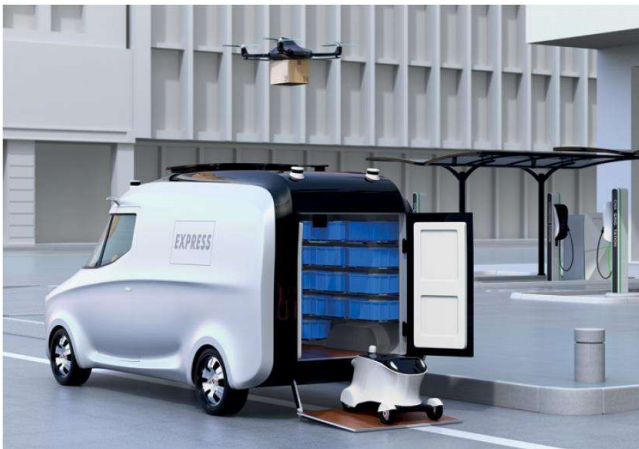
SARAHH (projeto europeu, em processo de avaliação)

Transporte local com veículos autónomos (aumento do alcance de abastecimento)