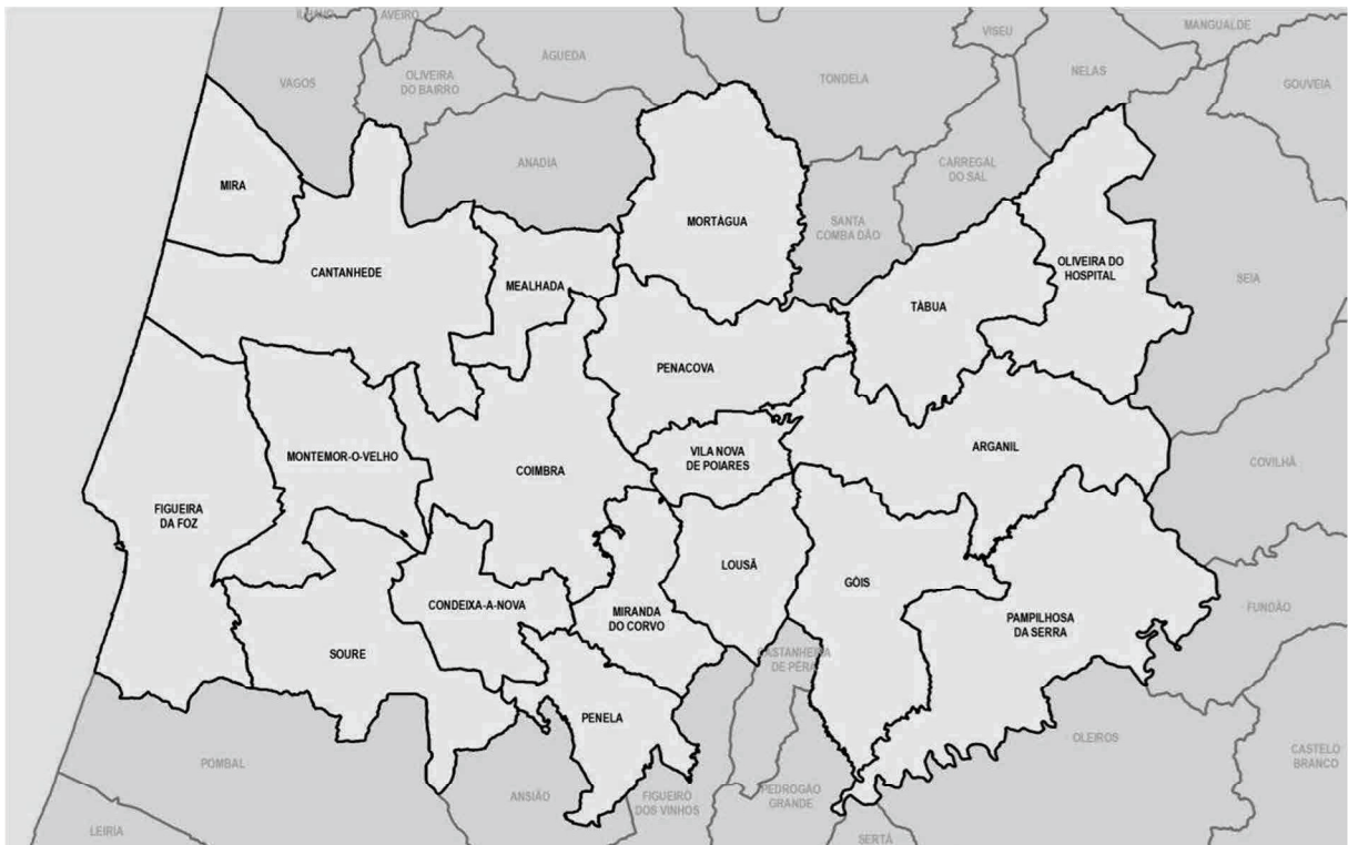
Figura 1 - Zonamento tarifário